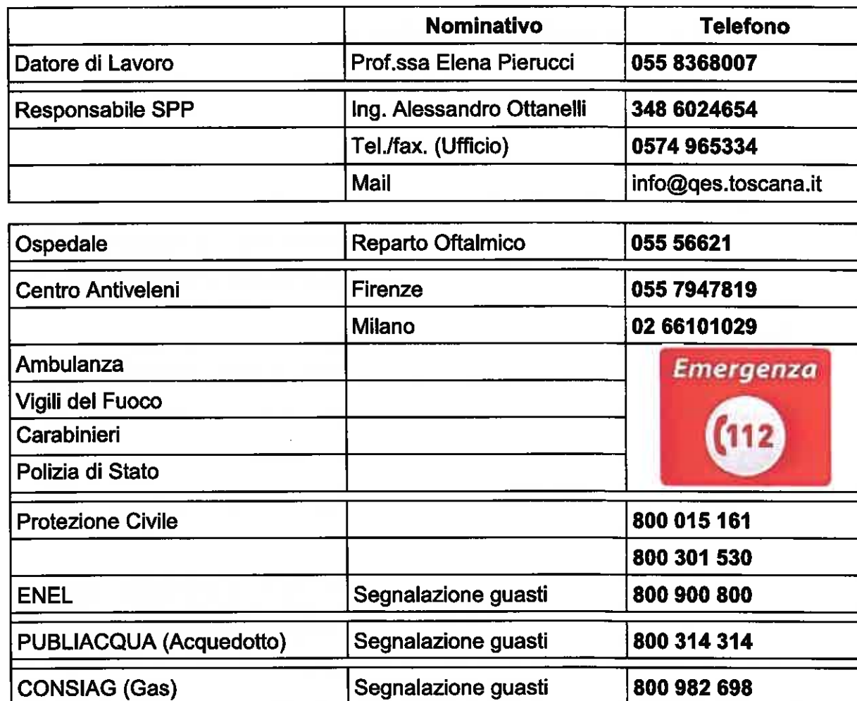
TABELLA NUMERI TELEFONICI UTILI